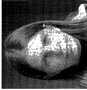
Christelle 30 ans

« Ce n'est pas bon pour le village. S'il n'y a plus rien ici, les gens vont partir s'installer en ville, il y aura donc moins de jeunes. On a déjà perdu une classe. »